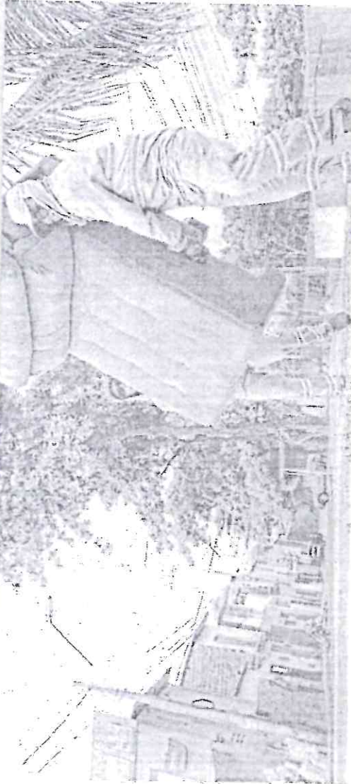
CAMINHÃO com equipe da Ecofor Ambiental realiza os serviços de limpeza urbana durante a rota