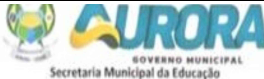
Tabela Salarial – Grupo Ocupacional do Magistério - 2024