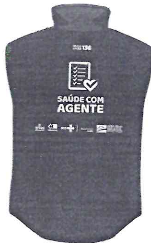
parte de trás