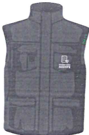
parte da frente