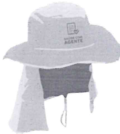
parte da frente do chapéu