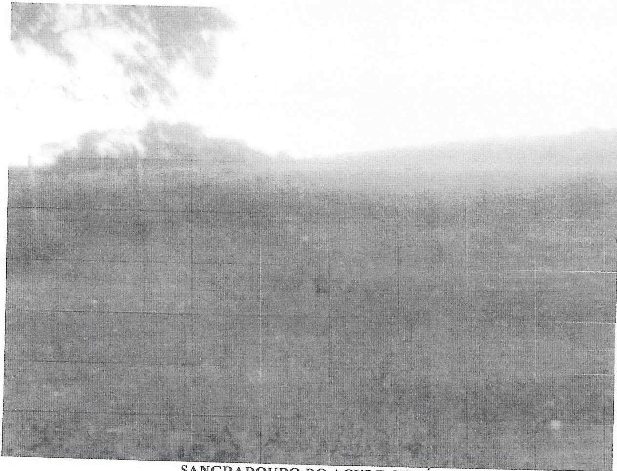
SANGRADOURO DO AÇUDE COXÁ