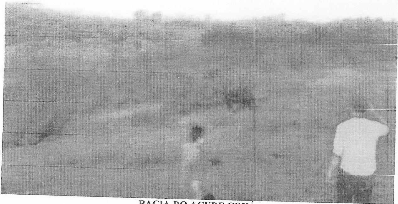
BACIA DO AÇUDE COXÁ