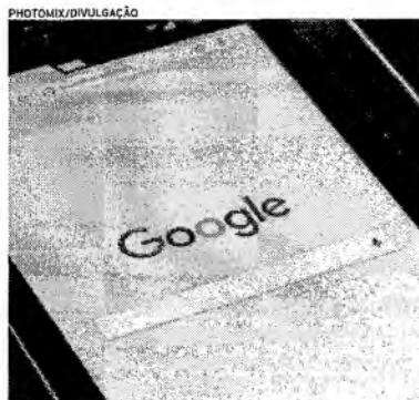
GOOGLE será uma das plataformas impactadas com a nova resolução

Plataformas Digitais | Resolução do Conselho Executivo das Normas de Padrão (Cenp) lista em nova categorização as redes sociais e dá maior segurança jurídica à publicidade online para clientes e meios de comunicação