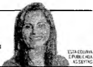
ESTA COLUNA É PUBLICADA A CADA SEMANA

Por JOELMA LEAL Jornalista e especialista em Marketing